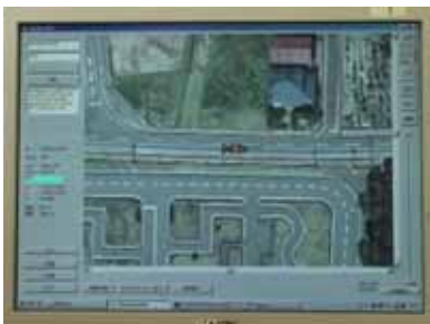
除雪管理者支援システム画面