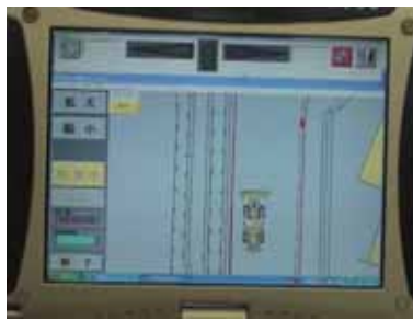
除雪作業支援システム車載画面