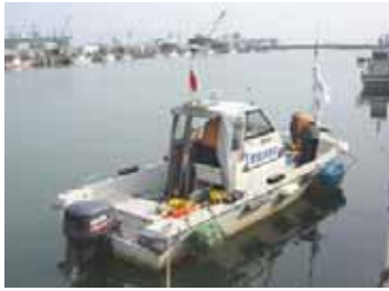
当社測量船 SUN - MARINE 号 全長 6.34m 最大搭載人員 10名

長い歳月をかけ確立した、当社が得意とする RTK-GPS を利用した 高精度深浅測量 は、 低コストで高精度な成果を得られることから、お客様から高い評価を受けています。