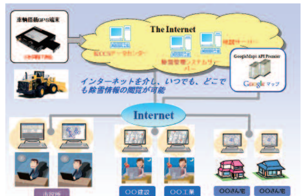
道路除雪管理システム全体構成図

市役所・除雪業者が利用する画面のほか、一般市民が閲覧できる地図画面があります。双方ともインターネットブラウザで表示する地図システムです。また、利用できる機能は市役所と