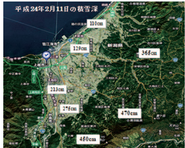
平成24年2月11日の積雪深

この年の雪による被害は、死者3人、重傷40人をはじめとして住居家屋損壊も175戸にもおよび除雪体制の重要性を再認識する結果となりました。