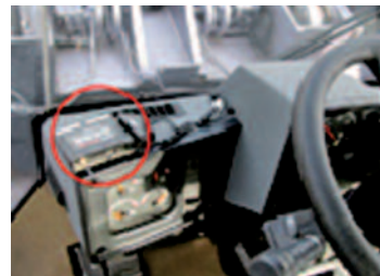
GPS通信端末の除雪車取付状況