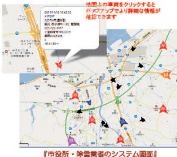
『市役所・除雪業者のシステム画面』